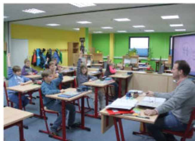
Spaß beim Lernen

Berufsfachschulen - staatlich anerkannte schulische Berufsfachschulen